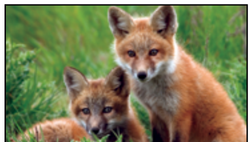
Et revepar får vanligvis 5-7 unger, og lever sammen i en familiegruppe