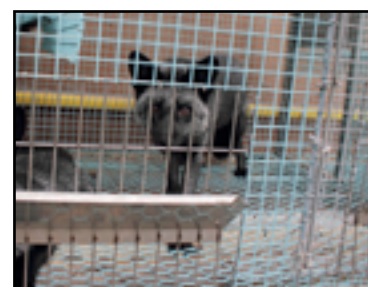
Det er tillatt å oppstalle en revevalp alene i buret.

Et vanlig revebur er på 0,8 kvadratmeter. Her kan reven knapt strekke seg ut - en rev er ca. 70 cm lang fra snute til halespiss. To rever som holdes sammen, har krav på 1,2 kvadratmeter plass, altså enda mindre areal per dyr. Buret inneholder en kasse og en liten hylle til å sitte på. Fôret serveres i form av fiberløs grøt. De har en "leke", som typisk er en trepinne. (15)