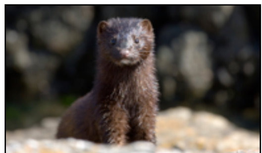
Villmink jakter like gjerne i vann som på land.

Minken tilhører mårdyrslekten. Villminken som lever i norsk natur er en nykommer. Den ble innført fra det nordlige Amerika til Europa for pelsdyroppdrett i 1920-årene. Mink har jevnlig rømt fra farmene, og deres etterkommere har etablert seg over hele Europa.(9)