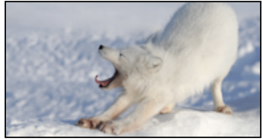
Fjellreven lever i de arktiske områdene rundt Nordishavet.

Fjellreven, eller polarreven, lever i de arktiske områdene rundt Nordishavet, og har vært utbredt i høyfjellsområdene i Sverige og Norge. På grunn av sin vakre, hvite pels har fjellreven vært forfulgt av pelsjegere. Fjellrevbestanden har gått sterkt tilbake, og er i ferd med å bli totalt utryddet i Skandinavia. Fjellreven ble totalfredet i 1930. I dag er det bare små, isolerte restbestander igjen. (13,14)