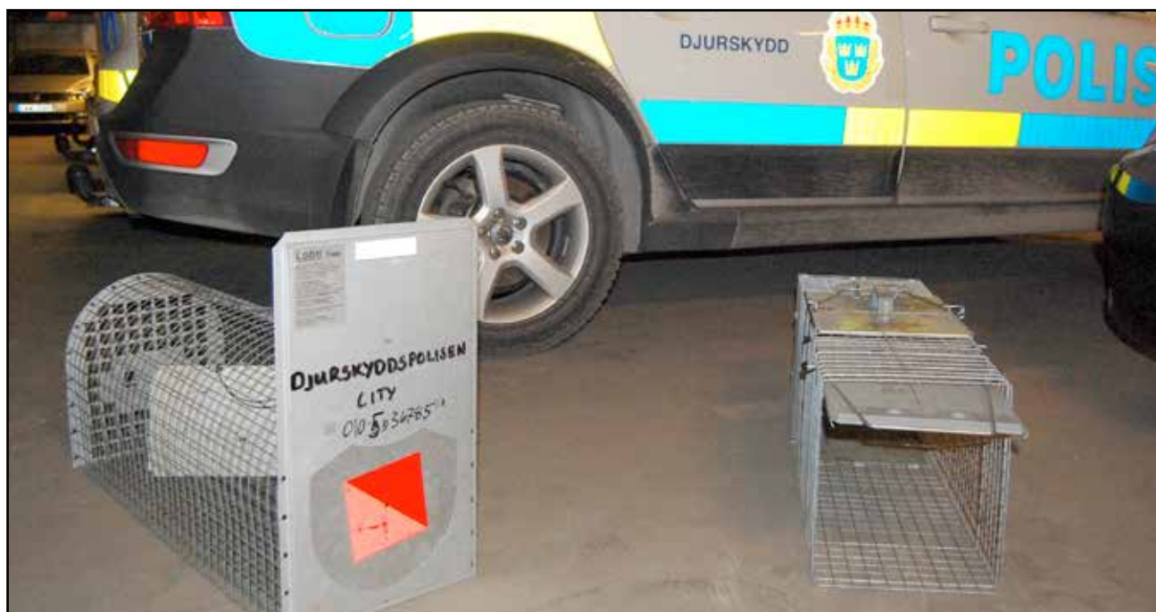
Djurskyddspolisen er godt utstyrt.

Beviskravet er ikke like strengt etter djurskyddslagen. Her må man ikke bevises at dyret lider. Mange saker blir derfor kodet om til vannskjøtsel, selv om mistanken i utgangspunktet gjaldt ren dyremishandling.