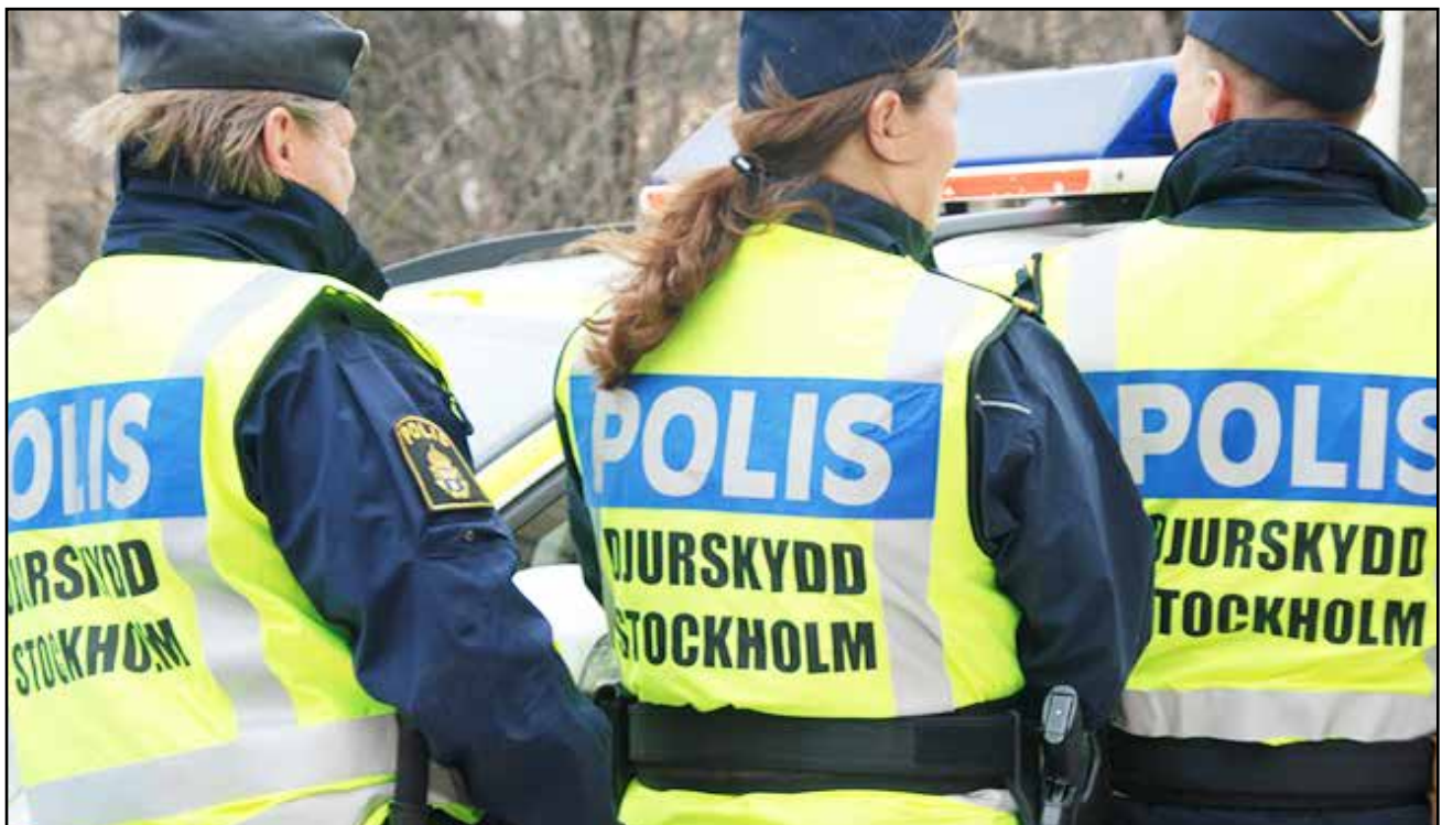
Djurskyddspolisen er godt synlige.

I ettertid er det flere politidistrikter i Sverige som har innført bedre organisering rundt dyrevernssaker, men det er ingen som er like store som i Stockholm.