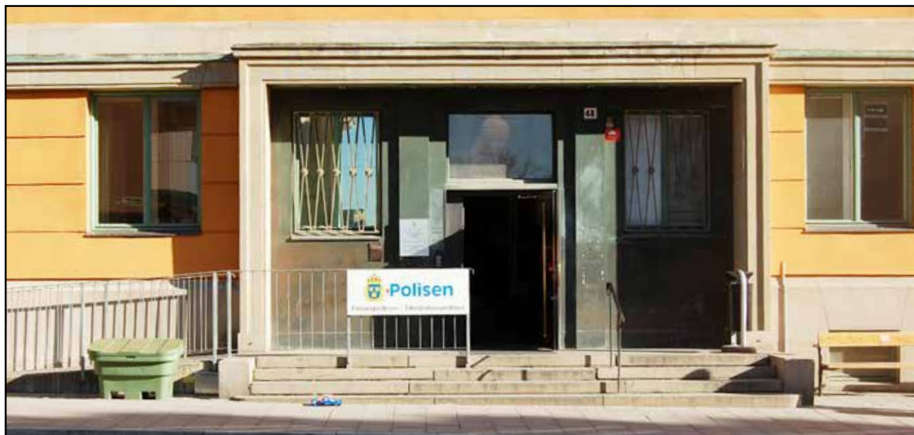
Djurskyddspolisens lokaler.

Oppklaringsstatistikken er forholdsvis lav, fordi bevisførselen i de fleste sakene er vanskelig. Det er sjelden vitner, og dyrene kan ikke beskrive hva de har vært utsatt for.