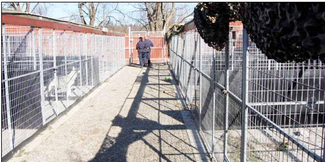
Oppstalling av hunder.

Djurskyddspolisen samarbeider også med dyresykehus, og da særlig Stockholms regiondjursjukhus, hvor de har en egen inngang så de slipper å vente.