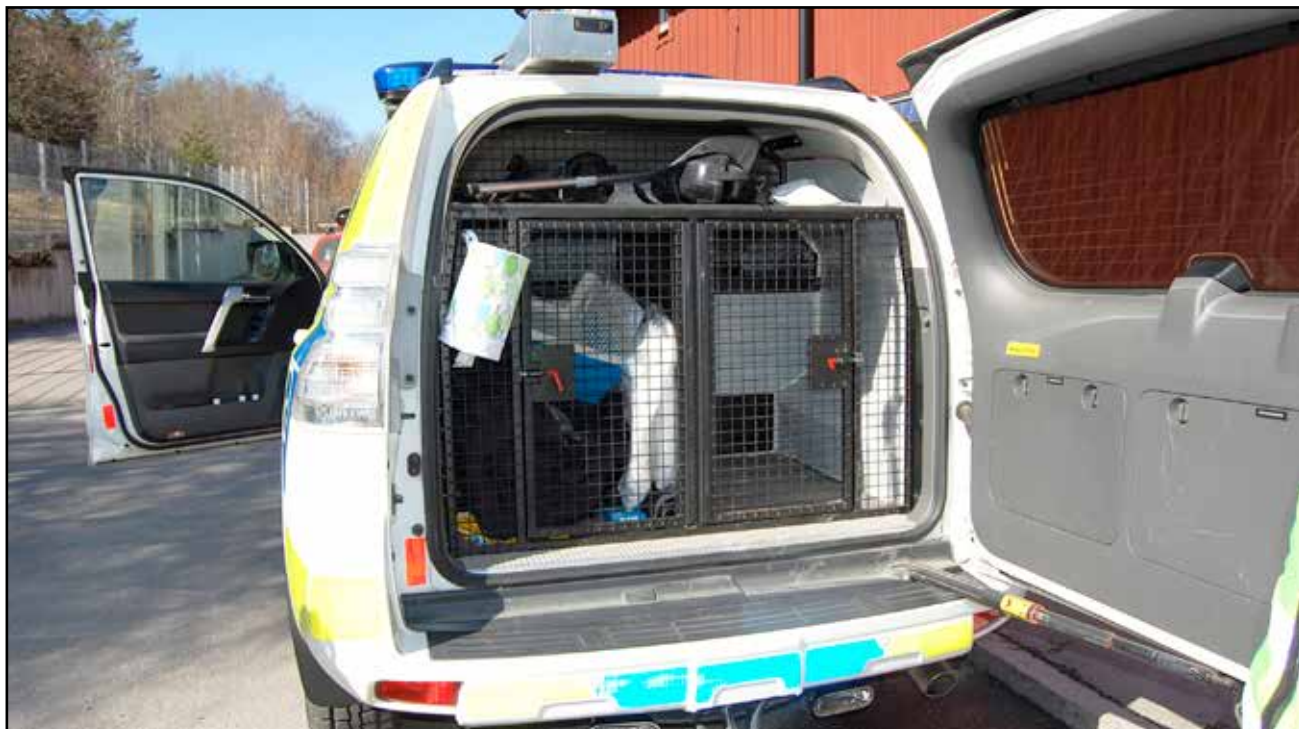
Politibilene er utstyrt slik at de kan ta med dyr for oppstalling i trygghet.

Veterinærer tar ofte kontakt med Djurskyddspolisen hvis de mistenker at det har foregått overgrep mot dyr.